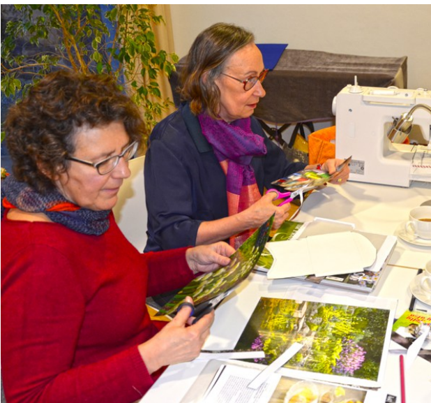
Die Creativ-Abteilung. Heute mal ohne Nähmaschine beim Umwandeln von Kalenderblättern (2018 !) in Faltschachteln und Briefumschläge.

Platine hinüber - das war's dann. Ab in die