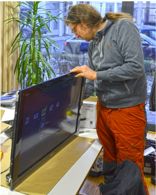
Unfreiwilliges Schwarzsehen? Da wissen wir