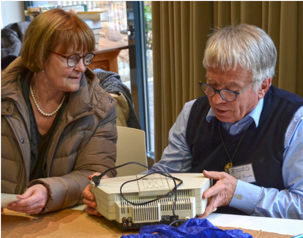
Ohne das geliebte Küchenradio will einfach keine gute Frühstückslaune aufkommen.