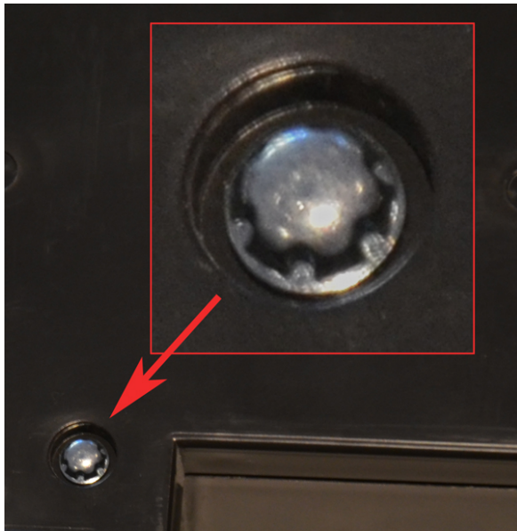
Neuer Schraubentyp (Montage vergrößert)